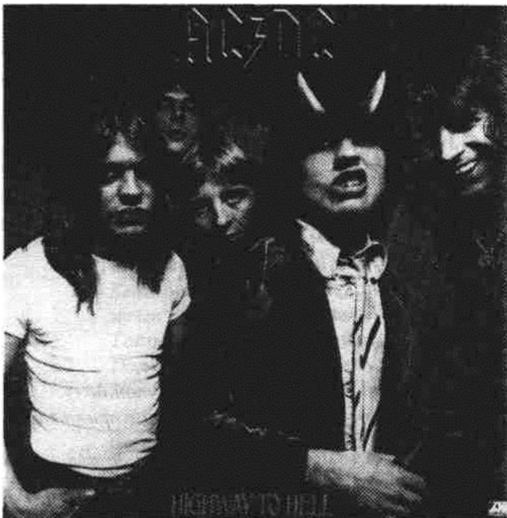
AC/DC - „Highway to hell" (1979). Тази плоча беше комерсиалният пробив на групата

В тази песен е събрано всичко за музикантите от AC/DC . „Рокендролът е прекият път към ада", потвърждава китаристът Енгъс Ъънг. Но кой си е мислил, че с тази песен ще стане още един сериозен поврат? „Не ме спирай, хей, хей, хей..."