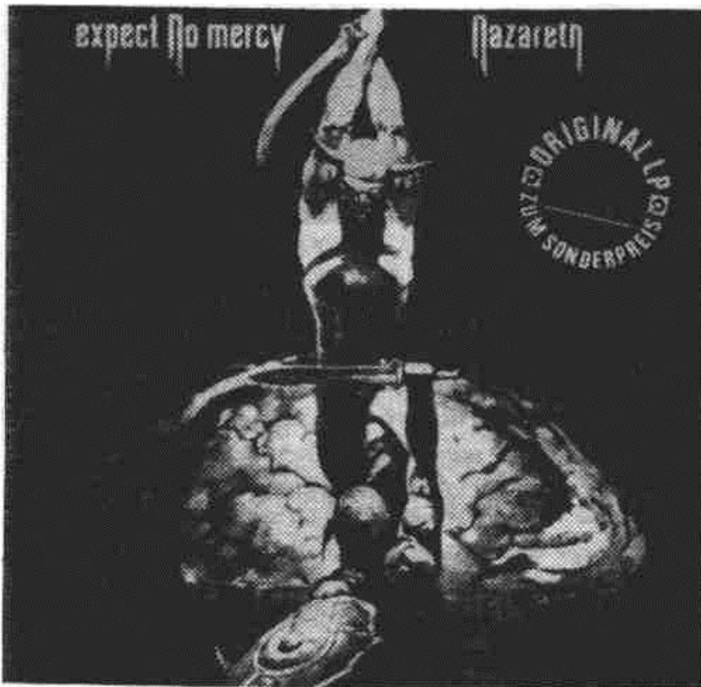
Плочата „Expect to Mercy" (1977) на „Nazareth". Вижда се съвсем ясно.