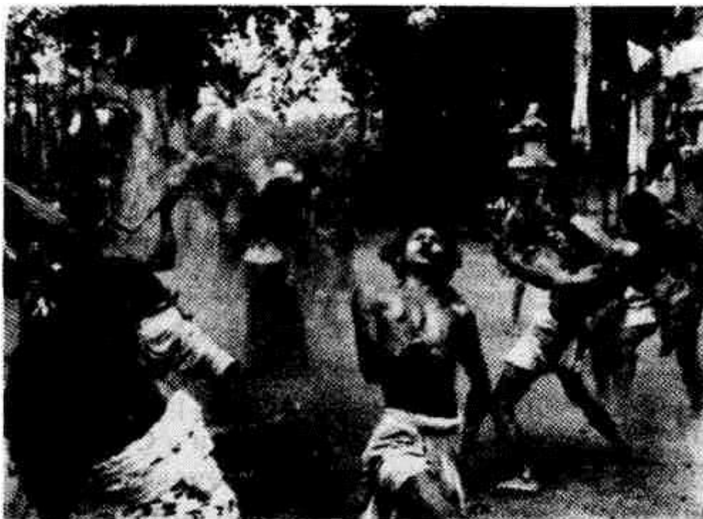
Екстазен танц на остров Бали