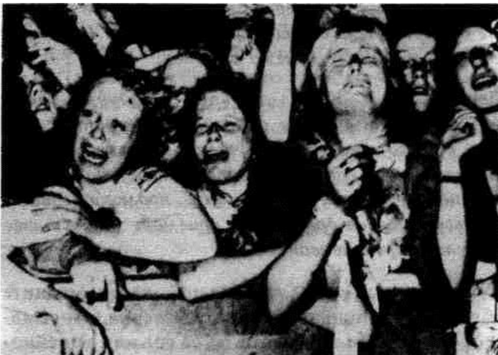
Масова истерия по време на един концерт в Лондон. 800 души изпадат в безсилие.

Rock'n' Roll-ът е изключително повлиян от африканските култове. Във връзка с това „Encyclopaedia Britannica“ прави съвсем ясна констатация: „Африканските танци, водещи до обладаване от нечисти духове, достигнаха Новия свят... Танцуващите биват обсебени от африканското божество и започват да правят умопомрачаващи движения, които говорят за характера на това божество.“ 8