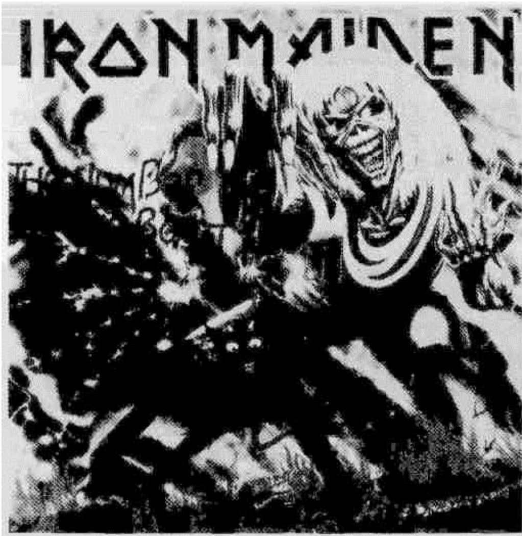
Iron Maiden - „The Number of the Beast“ (1982)

През 1982 година британската „хевиметъл“ гру-па Iron Maiden прави сензация с дългосвирещата плоча „The Number of the Beast“ („Числото на звяра“). Изпълнението на заглавната песен от тази плоча е кулминация на концертите им. Фанатично въодушевление обхваща публиката, когато Брус Дикинсън възпява числото на Антихриста: „666 the number of the beast, 666 the one for you and me “ („666 — числото на звяра, 666 — единственото за мен и теб“).